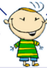
L'enfant de cinq ans

Pleure parfois, le contact physique est important, est près de ses émotions, méfiants, on doit gagner sa confiance, s'ennuie parfois.