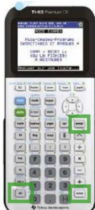
TI 83 CE