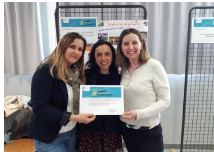
Des diplômes de participation sont remis aux participants

Chaque projet est présenté sous forme d'un stand et permet les échanges