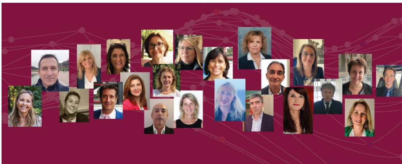
Les membres du comité de pilotage de la JAP 2023

L'orchestre du collège Versailles de Marseille ouvrira la JAP et les élèves du lycée Montgrand de Marseille clôtureront la journée.