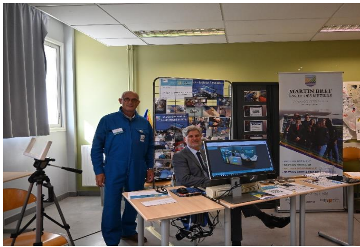
Le projet « En atelier de carrosserie - après la clé, nous utilisons la "tablette à molette" » présenté par le lycée professionnel Louis Martin Bret de Manosque (réseau Giono)