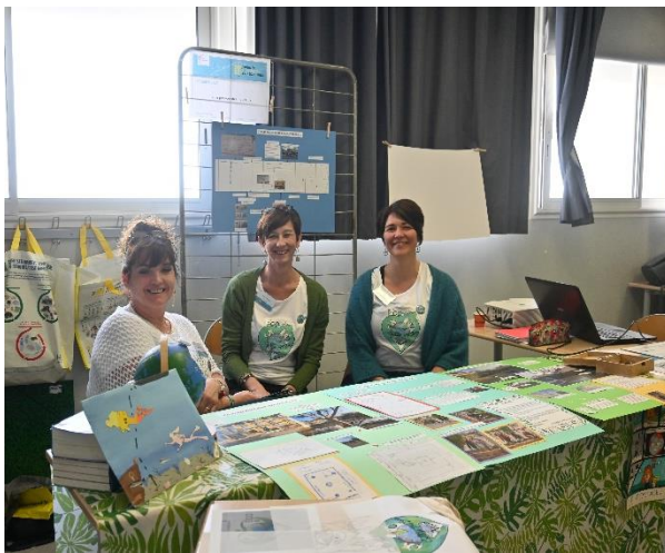
Le projet « Le pouvoir des fleurs » présenté par le collège J.M.G. Itard d'Oraison (réseau Giono)