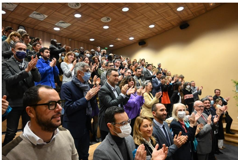
Ouverture de la JAP 2022 au collège Jean Jaurès de la Ciotat

Cet évènement est propice à la diffusion des bonnes pratiques qui peuvent ensuite être reprises et transposées dans d'autres écoles ou établissements.