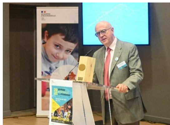
Remise des trophées par M. le recteur en 2022

Cette journée visant à encourager l'innovation, l'audace et l'engagement est conclue par une remise de trophées pour mettre à l'honneur quelques projets et actions présentés sur les stands.